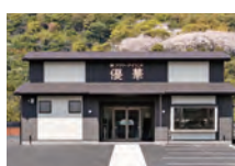
斎場使用料 通夜・葬儀 ホール使用料