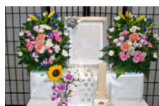
後飾りセット (生花付き)