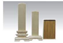
小物一式 線香・位牌 椅子・棺台 etc