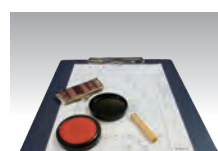
諸手続き手配 火葬場利用 予約手続