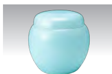
骨壺セット 翠玉5寸・桐箱 箸・骨覆い・分骨 風呂敷・記名入り