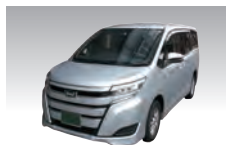
霊身送り 2回 (10km未済)