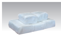
ドライアイス 1日分