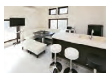
通夜使用料 1日分 (宿泊費)