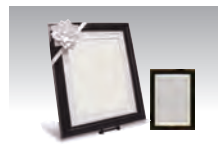
ご遺影写真 カラー キャビネ付