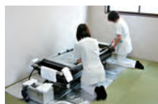
湯灌の儀 安らかな旅立ちを 願う儀式です (仏式衣装付き)