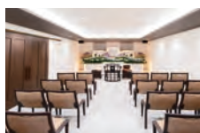
斎場設営費 式場・受付等 設備費