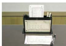
受付 通夜 葬儀受付設備