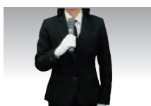
司会 2回 通夜・葬儀